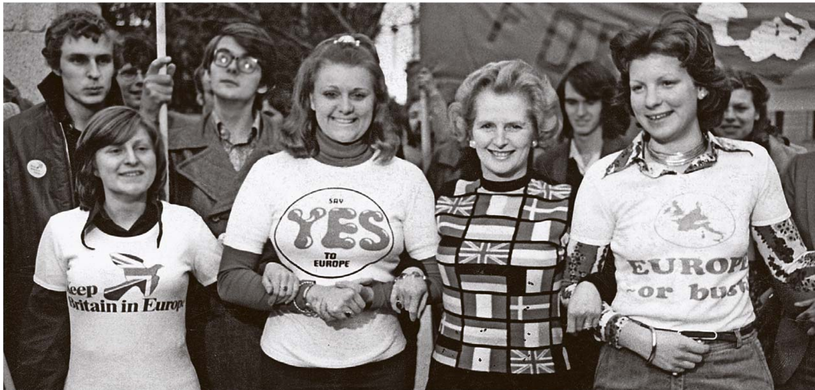
Themen des Tages Seite A 2 Standpunkt Seite A 4

Es war einmal in London: 1975 unterstützte die frisch gewählte Tory-Chefin und spätere Premierministerin Margaret Thatcher (2.v.r.) das britische Referendum zum Verbleib in der Europäischen Wirtschaftsgemeinschaft (EWG) – das mit „Ja“ endete. Der Vorgänger-Organisation der EU war das Königreich 1973 beigetreten. 47 Jahre und ein anderes Referendum später, an diesem Freitag um Mitternacht, endet die Geschichte der Briten in der EU. Der Brexit-Tag ist da.