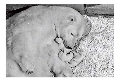
Flocke und ihre drei Babys (Video-bild).

Flocke hatte 2007, knapp ein Jahr nach dem Berliner Eisbär Knut, eine große Eisbär-Begeisterung in Deutschland ausgelöst.