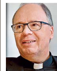
Die Situation im Bistum werde sich weiter „verschärfen“, sagt der Trierer Bischof Stephan Ackermann.

TRIER (dpa) Der Trierer Bischof Stephan Ackermann rechnet damit, dass sich die Zahl der Priester im Bistum bis 2030 um die Hälfte reduzieren wird. Die Lage werde sich „erheblich verschärfen“ – von 283 aktiven Seelsorgern Ende 2019 auf wohl nur noch 135 in zehn Jahren.